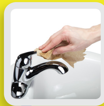
7 FERMER AVEC LE PAPIER